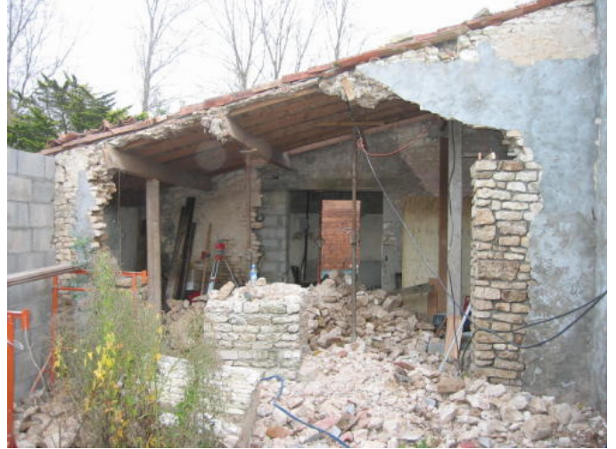
Het gat tussen ruimte 3 en 4.

Voorts is de gevel van ruimte drie opgetrokken, met ook hier ruimte voor een raam en een deur.